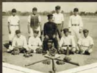
野球部以操場為棒球場