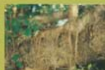
昔日大榕樹下拍馬路