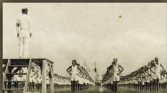
第一回運動會大會操