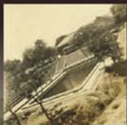
學長自己動手興建的游泳池