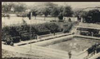
游泳池的啟用儀式