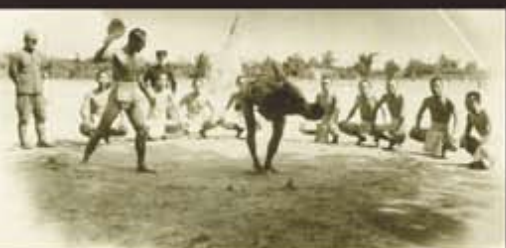
黃沙滾滾的操場用來作相撲練習的場地

日治時代，本校操場一直不是很正式，在學校東邊圍個籬笆，籬笆內的大片黃土廣場，行朝禮也可以，運動會也可以，升旗也可以，相撲也可以，甚至打野球也可以。唯有大榕樹始終忠厚老實地屹立在學校正中央，像大傘般庇蔭著竹園的健兒。