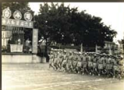
第六屆運動大會 校閱