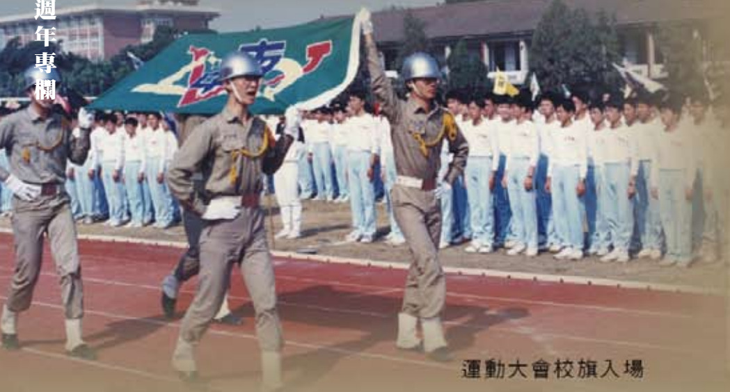
運動大會校旗入場