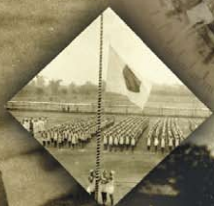
第一回運動會 (昭和三年十一月二十五日)