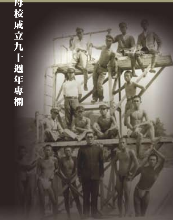
早期學校的水泳部

游泳池的出現算是一種眾志成城的表現。本校很早就建有游泳池，就是位於今人文教育大樓的正下方，是老學長們同心協力，有人挖土，有人推單輪車，大家一起勞動而來的。