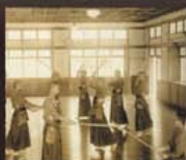
日據時代的武德殿是劍道與柔道的訓練場