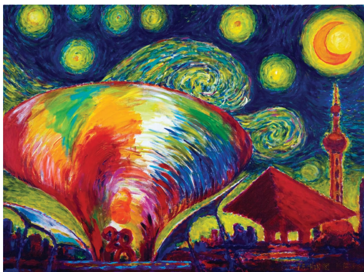
▲繁星下的陽光谷/陳錦芳 97×120cm