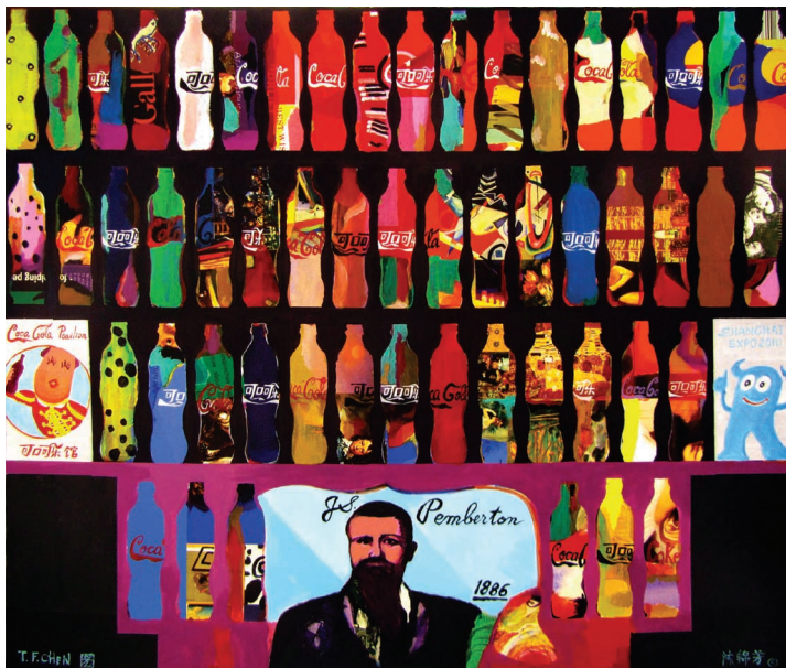
▲可口可樂館/陳錦芳122.4x145.5cm