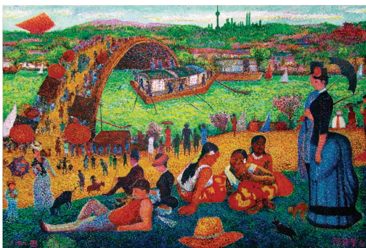
▲清明上海遊（中國館）/陳錦芳 130x194cm