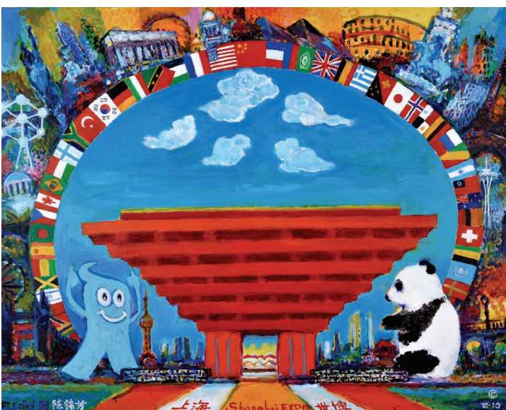
▲歡迎參加2010上海世博/陳錦芳 80×100cm

在今日電腦普及的全球化時代，有二個關鍵詞為世人所習用，即硬體及軟體，但尚有另一關鍵詞日益普遍，即靈體，這是我在1980年世界科學及哲學會議，演講我的文化哲學理論：五次元世界文化觀時所提出來的詞，也就是發明、創造硬體及軟體的靈慧心智。科技發明改善生活，藝術創作豐富生活。150多年來的世界博覽會就是在展現靈體在物質及精神方面的創新及時尚。城市要更美好，不能沒有靈體光輝的照耀及其產品，城市生活要更美好，不能缺少心靈的重建，精神的提升，而藝術為其潛移默化的載體，而後可達到“藝術生活化，生活藝術化”的理想境界。