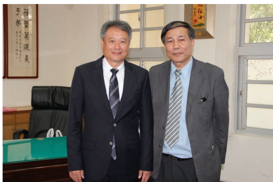
▲由左至右李安、公關主委李賢勇合影

李安後來考上世新編導，全班頗為驚訝，他畢業後曾幾度出席同學會；我們這一班也因為出了李安，同學會出席率特別高。後來他到美國留學，新正過年時的同學會，我們都會到校長公館拜訪李校長夫婦，並且探尋李安近況，校長都告訴我們李安一卻很好，但是後來